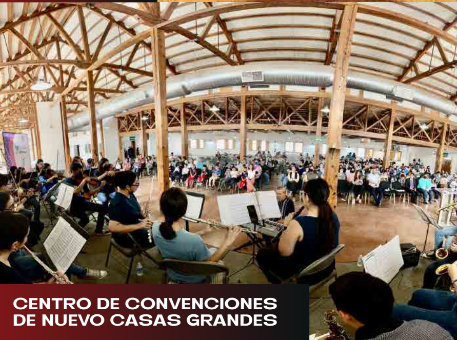
CENTRO DE CONVENCIONES DE NUEVO CASAS GRANDES