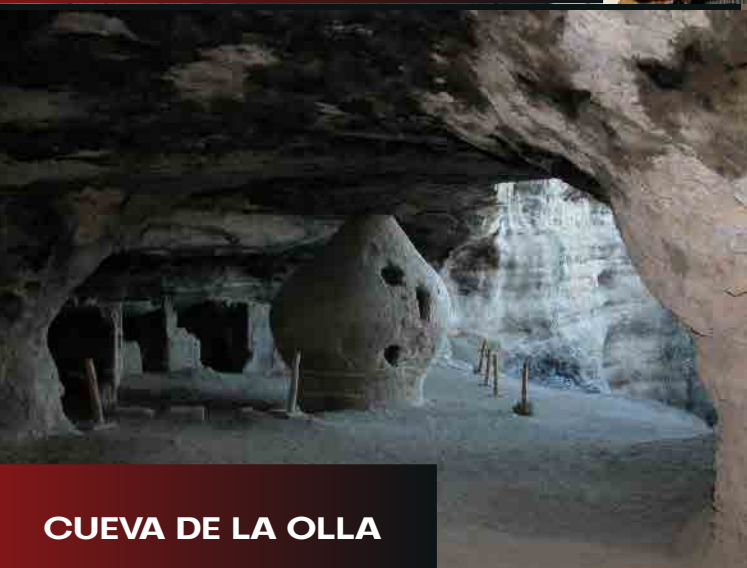
CUEVA DE LA OLLA